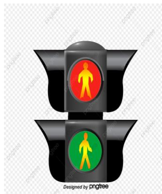
SEMÁFORO PARA PEDESTRES